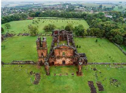
Sítio arqueológico de São Miguel das Missões

Mais informações podem ser obtidas por e-mail (alvarotheisen@gmail.com).