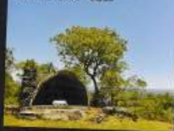
Cruza do Cero Pelado

No final do Sec. XIX, o Capitão de um Navio Italiano sofreu um Naufrágio no Rio da Prata. No auge do seu desespero e já sem esperanças fez uma promessa: se conseguisse a salvação procuraria um lugar ermo e solitário e por trinta anos se dedicaria a oração, a pregar o evangelho e ajudar as necessitadas. Venha conhecer o local onde viveu o Monge e que por muitos anos levou fiéis a realizar batismos, orações, benzeduras e até casamentos!