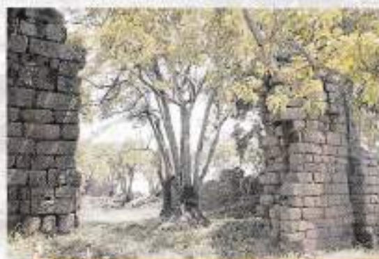
Ruínas de São Lourenço