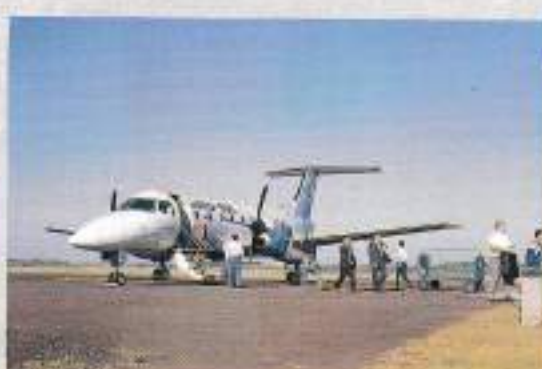
Aeroporto Sepé Tiarajú