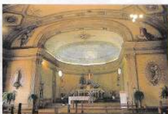
Capela do Verzet