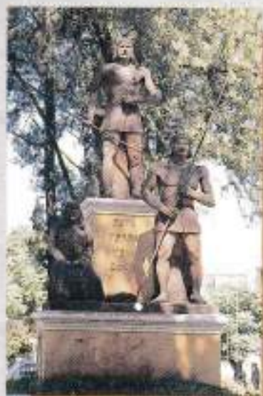
Monumento ao Índio