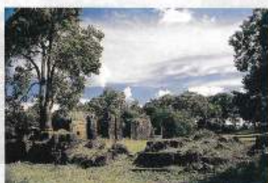
Ruínas de São João Batista

Enquanto os missionários n, seu destino era decidido da Europa. O conflito pela as terras entre Portugal e vez com que o tratado de desencadeasse a Guerra a, onde surge o lendário Sepé Tiaraju e seu brado "esta terra tem dono". Os am derrotados e dispersos território. Posteriormente, em a anulação do tratado de reorganizaram. No entanto, os Padres Jesuítas foram mente expulsos do continente iniciando assim a inevitável ia das Reduções Jesuíticas.